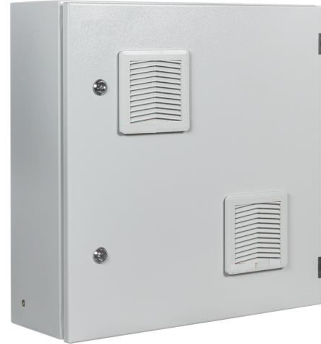
Шкаф климатический АТ-ШК-4А-УП-ВО (v2)